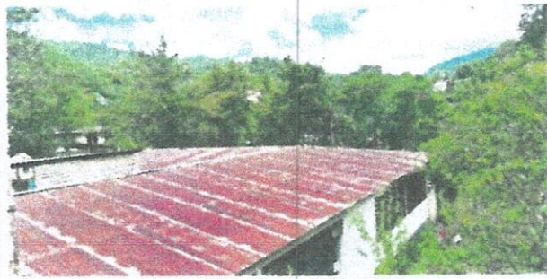
Foto1: Sustitución de cubierta de lámina de 5 aulas del módulo 1.