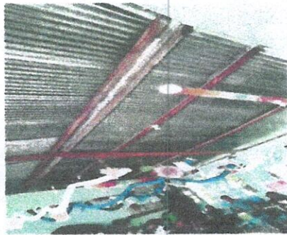
Foto 3: Sustitución de estructura de soporte de madera, por metal en dos aulas del módulo 1.