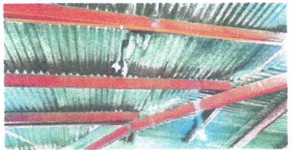
Foto 6: Mantenimiento a estructura de soporte de metal del módulo 1.

Observación: Si es necesario se pueden agregar hojas adicionales y actualizar el número de hojas.