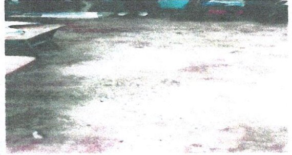
Foto 2: Reparación de piso de torta de concreto en 1 aula del módulo 1.